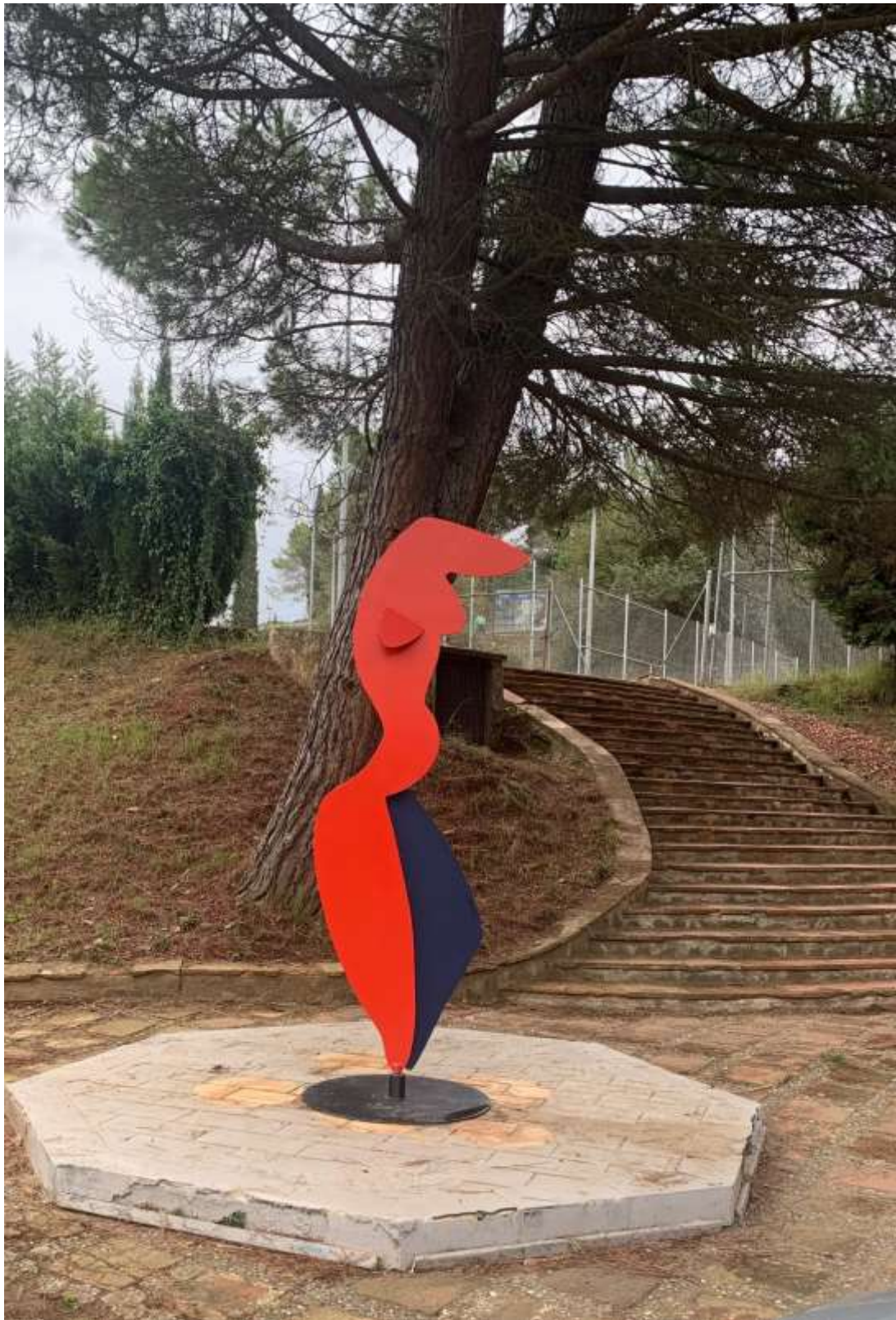
Goig de Viure I de Alfredo Lanz al Club Esportiu Valldoreix