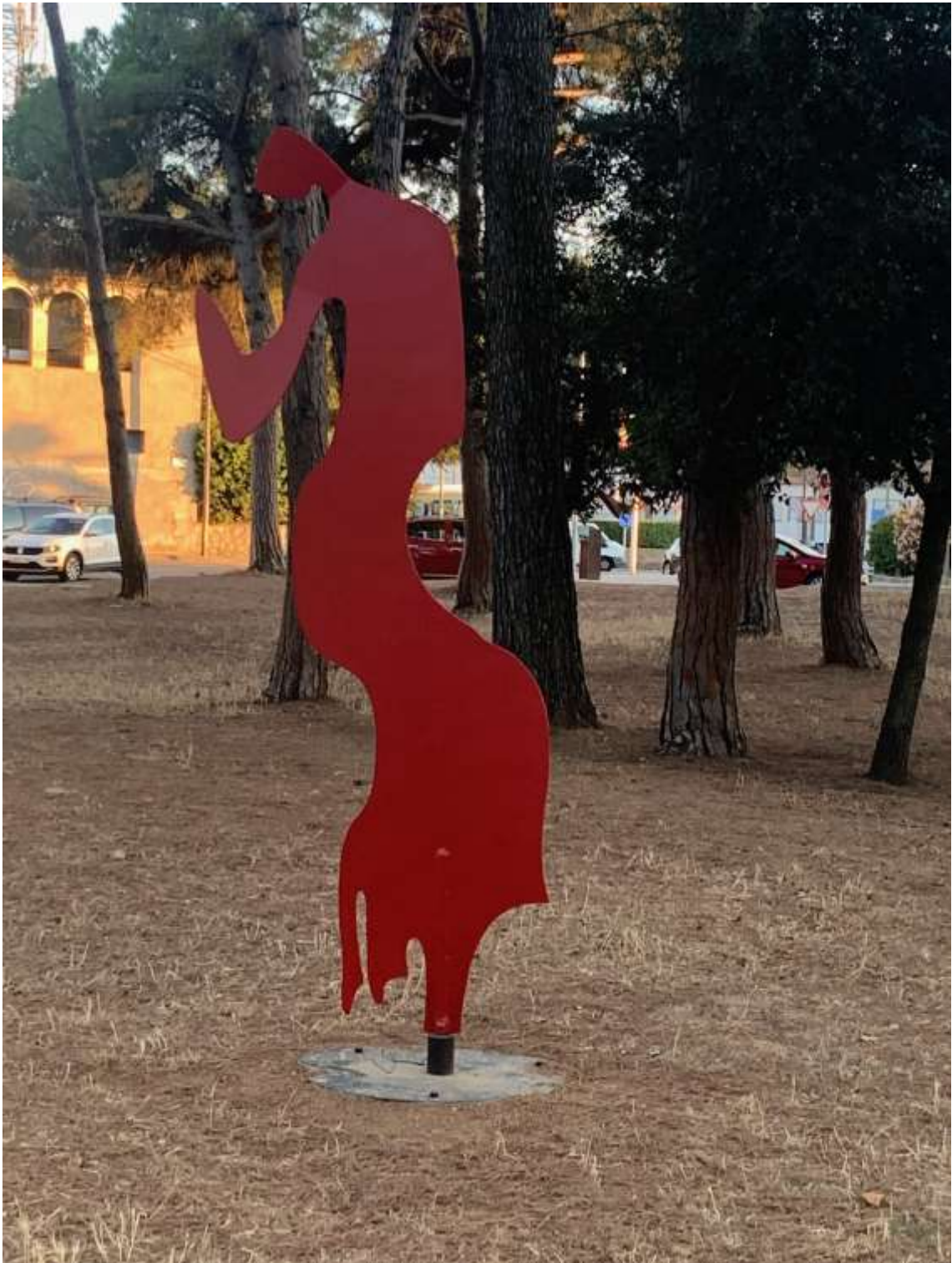
Goig de Viure II de Alfredo Lanz a la Pl. Cap Valldoreix