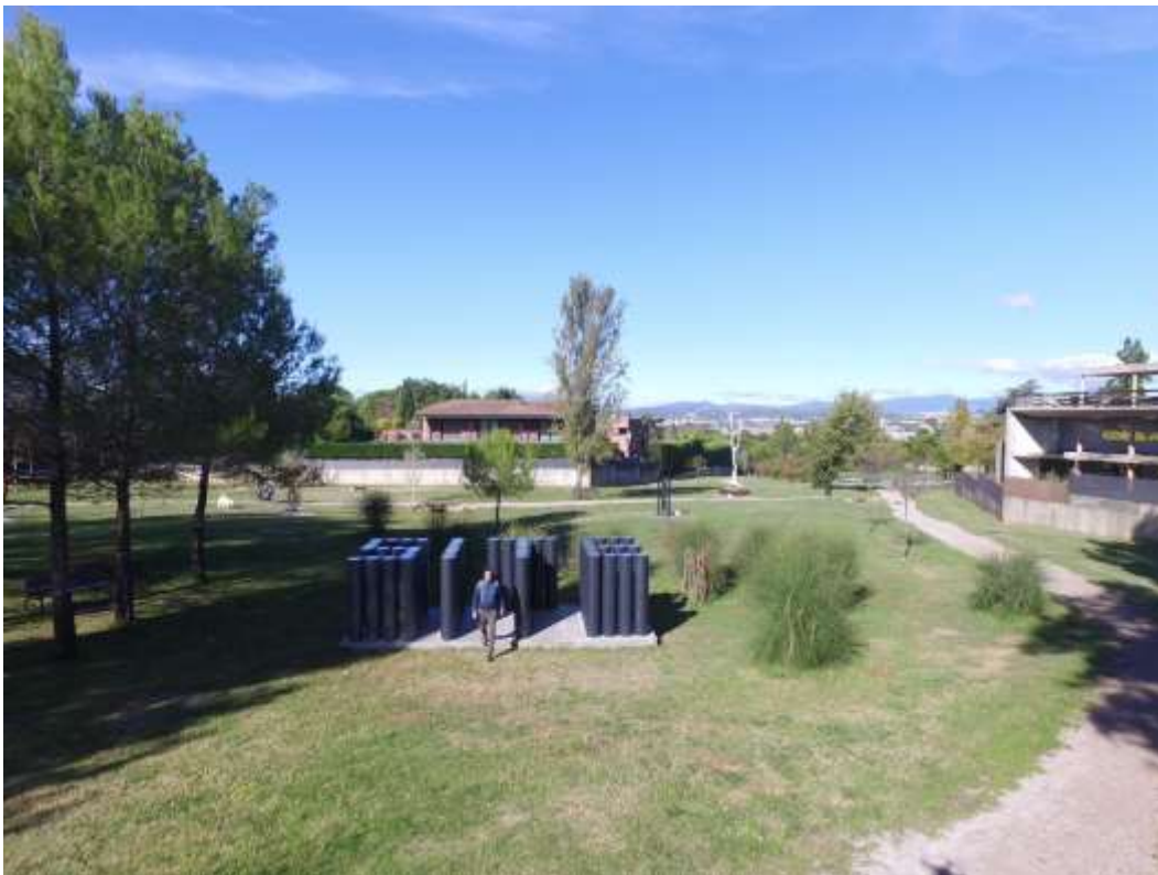
Parc de Sant Cebrià (Passeig Olabarria) – Valldoreix