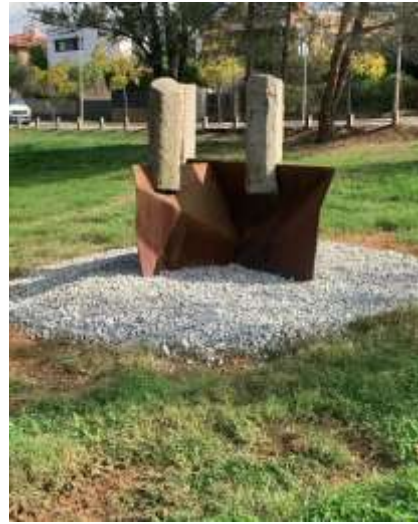
ADNVOLCÀNIC DE ERNEST ALTÉS