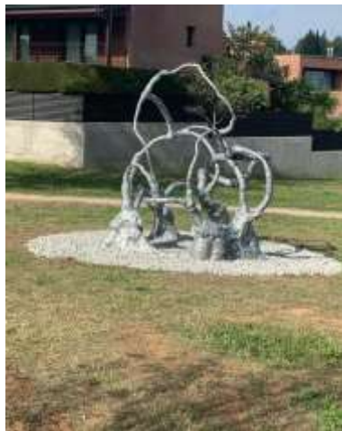
SAPRÒFITA DE ALBA E. PELIGERO