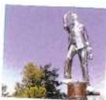
Les escultures ocupen Valldoreix

Valldoreix estrena enguany la Biennal d'Escultura, “Valldoreix dels Somnis” és el nom de la proposta que portarà les obres de fins a 23 artistes a diferents