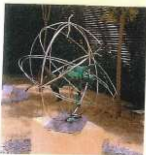
Madre Tierra CEBIDA