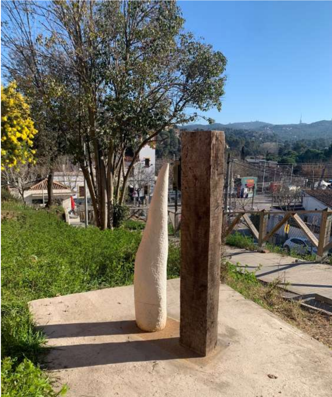
Màquina! de Toni Batllori situada al camí de vianants de l'Estació a la Església de Sant Cebrià