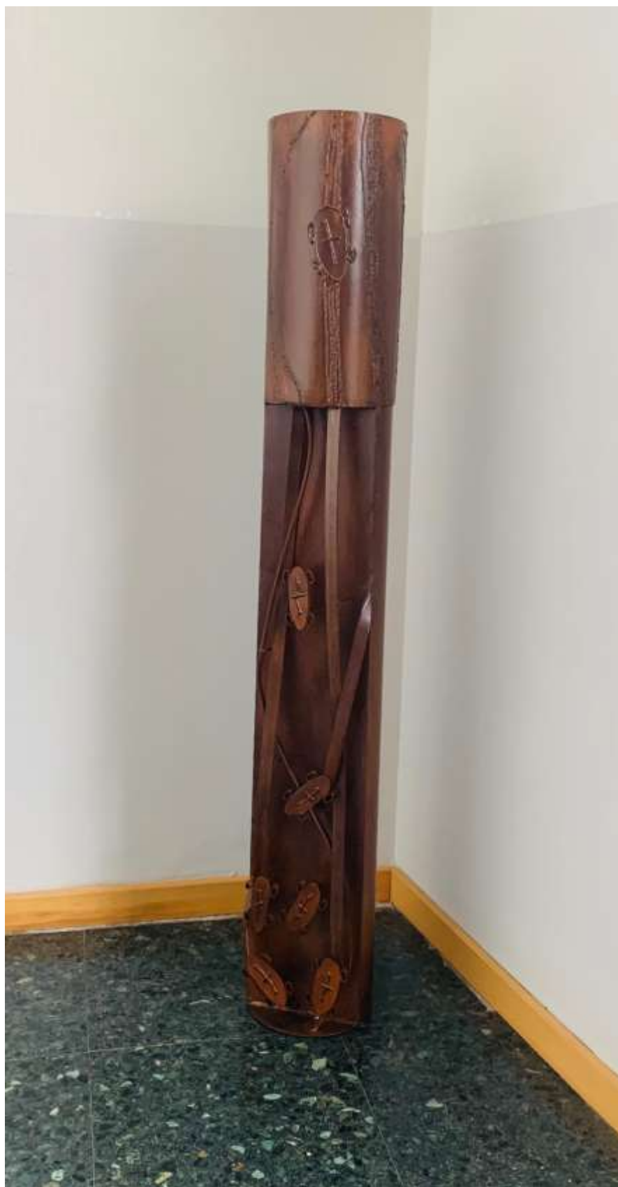
Devalladaferro (una peça) de Neus Colet a la Casa de la Vila, tercer premi I Biennal