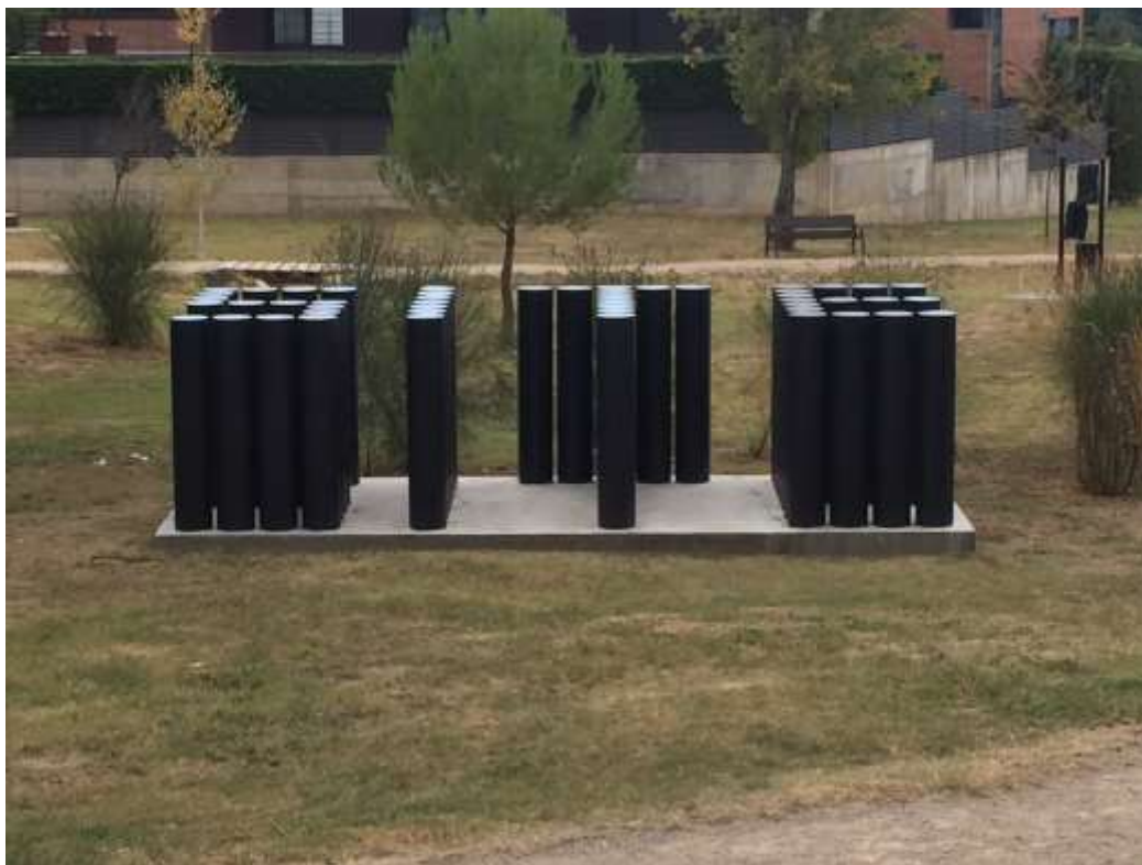
Site de Stanislau Roca i Calaf al Parc de Sant Cebrià obra guanyadora II Biennal premi a la Singularitat