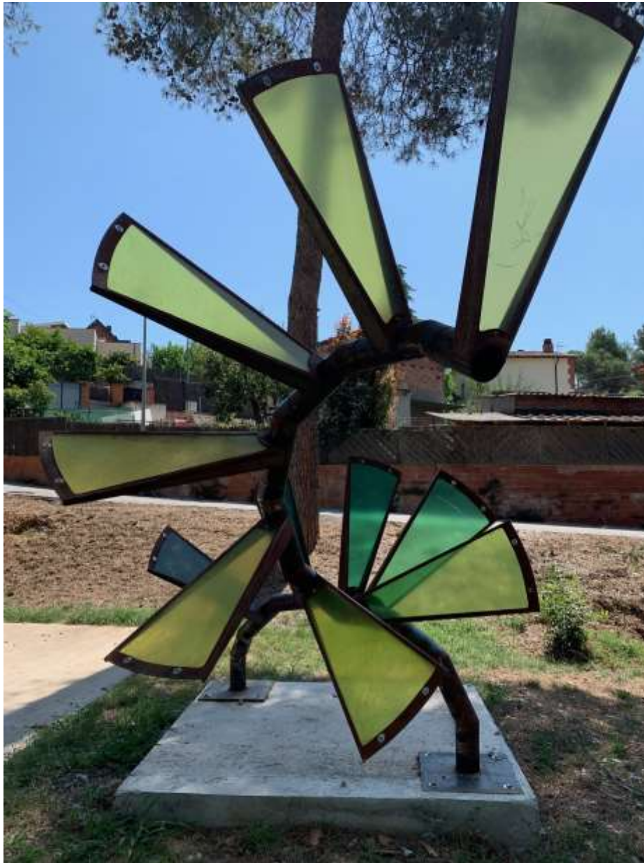
Hèlix de l'artista Pense. Obra guanyadora de la segona biennial. Emplaçada a la Pl. de les Ones, La Serreta.