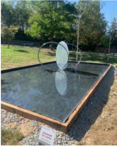
DINAMISME EN L'ESPAI DE MIQUEL ANDRINO