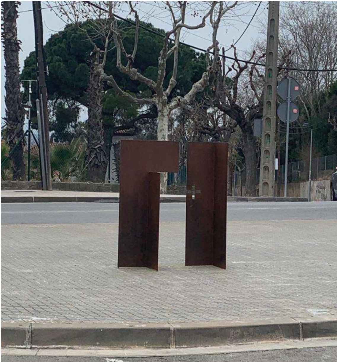
Puerta al Cielo II de Federico Eguía a la cruïlla del Pg. Olabarria i Carrer de l'Església