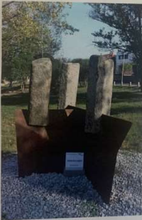
Adnvolcànic, d'Ernest Altés.

E rnest Altés és un dels escultors catalans que té més obra en l'espai públic. Per exemple, d'un extrem a l'altra de la Cerdanya, podem trobar les seves obres en la plaça central de molts pobles que conformen la zona i, a All, el seu estudi i lloc de treball. El ferro, la pedra i darrerament el vidre gairebé sempre són presents en la seva producció.