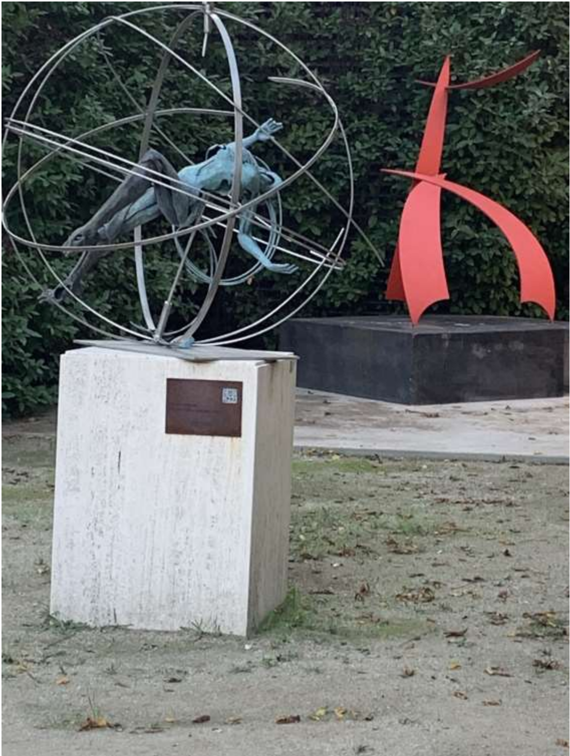
Jardins Onze de Setembro