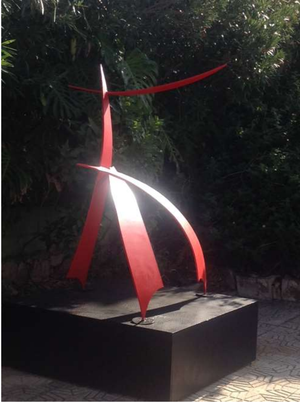
Portal del Vent No. 8 de Teo San José als Jardins Onze de Setembre