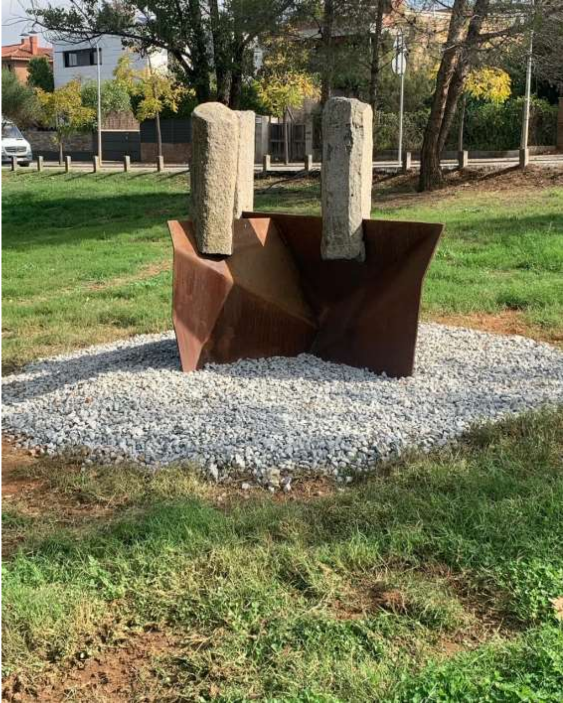
Obra guanyadora III Biennal ADNVOLCÀNIC – Ernest Altés